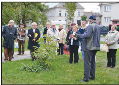
Komise životního prostředí (str. 7-16)