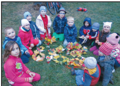
Spolek rodičů při MŠ (str. 22-24)