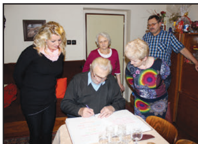
Informace z matriky (str. 3-4)

Za původnost a věcnou správnost příspěvků odpovídají jejich autoři. Názory vyjádřené v článcích nemusejí být totožné s názorem vydavatele a redakční rady.