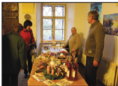
Kulturně - sportovní komise (str. 5-6)