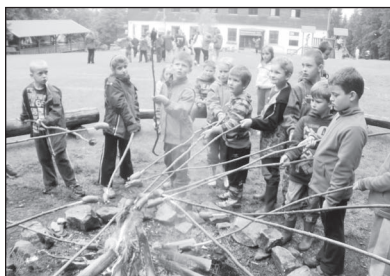
Z činnosti základní školy (str. 12 - 13)