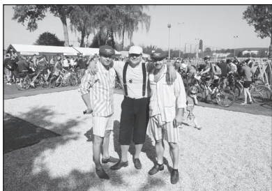
Z činnosti obecních spolků (str. 13 - 20)