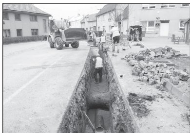
Informace stavební komise (str. 8 - 9)