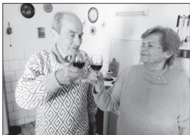
Zajímavosti z matriky (str. 6 - 7)