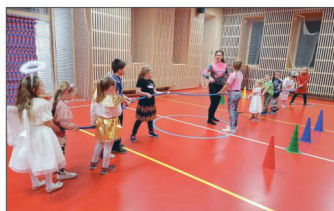
T. J. Sokol Smržice (str. 24 - 27)

Za původnost a věcnou správnost příspěvků odpovídají jejich autoři. Názory, vyjádřené v člancích zpravodaje, nemusí být totožné s názorem vydavatele a redakční rady.