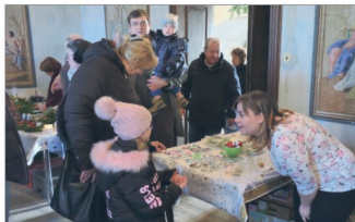
Kulturně-sportovní komise (str. 10 - 14)