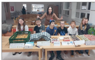
Základní škola ( str. 18 - 21)