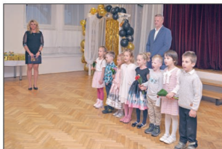
Matrika (str. 6 - 9)