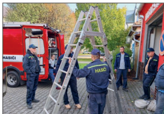
SDH Smržice (str. 37 - 40)

Za původnost a věcnou správnost příspěvků odpovídají jejich autoři. Názory, vyjádřené v článcích zpravodaje, nemusí být totožné s názorem vydavatele a redakční rady.