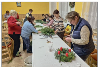
ČZS Smržice (str. 31 - 33)