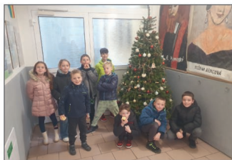
Základní škola (str. 17 - 20)