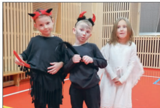
T. J. Sokol Smržice (str. 24 - 27)